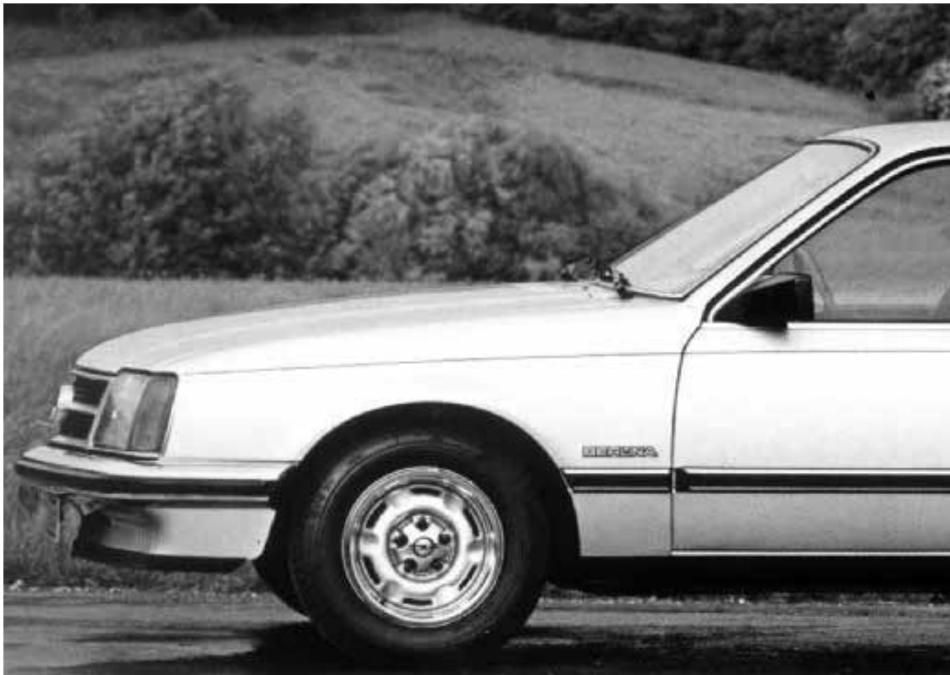
Commodore C: Der sportlicher Ableger der Rekord-Reihe kam mit einjähriger Verspätung auf den Markt und wurde nur bis 1982 produziert.

Debüt geriet der Absatz des wieder durchweg mit Sechszylinder-Motoren bestückten Commodore. Nach nur 82.820 Exemplaren war im Jahre 1982 Schluss, während der Rekord E noch bis 1986 weiter produziert wurde. 1982 erschien der – werksintern Rekord E2 genannte – Wagen mit überarbeiteter Front, die der Limousine nicht nur bedeutend mehr Eleganz verlieh, sondern den c_w -Wert auf 0,36 deutlich senkte. Kunststoffstoßfänger ein vergrößerter Kofferraum im optisch moderat verfeinerten Heck und – nicht zuletzt – ein neuer Basismotor mit 1,8 Litern Hubraum setzten die letzten Maßstäbe der Rekord-Produkti-