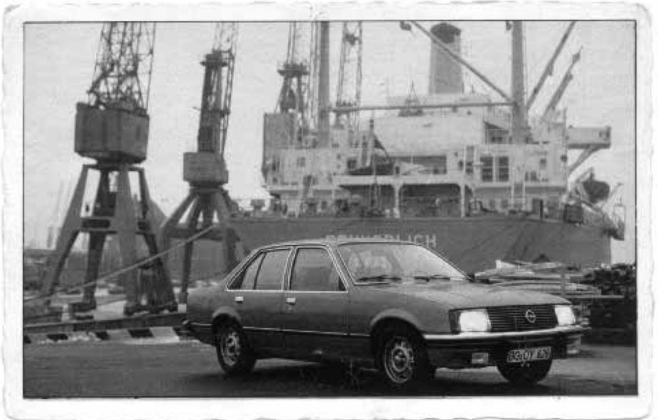
Rekord E1 als Ansichtskarte: Rolf Hainke (*1187) schickte dieses maritime Motiv an die Redaktion.