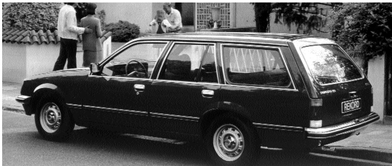
Nützlicher Transporter, ideales Freizeitmobil: Die Caravan-Version bot mehr als zwei Kubikmeter Stauraum.

maturenbrett versteckten Druckknöpfe für Nebelschlussleuchte und Nebelscheinwerfer jetzt – mit klaren Symbolen versehen – in der Mitte des Instrumententrägers zusammengefasst sind.“ Für das neue, komplett umschäumte Lenkrad gab es eingeschränktes Lob, da die Hupenbedienung sich auf den Knopf in der Mitte reduzierte. Praktischer waren die Haupttasten am Lenkradkranz der Berlina-Ausstattung. Insgesamt bescheinig-