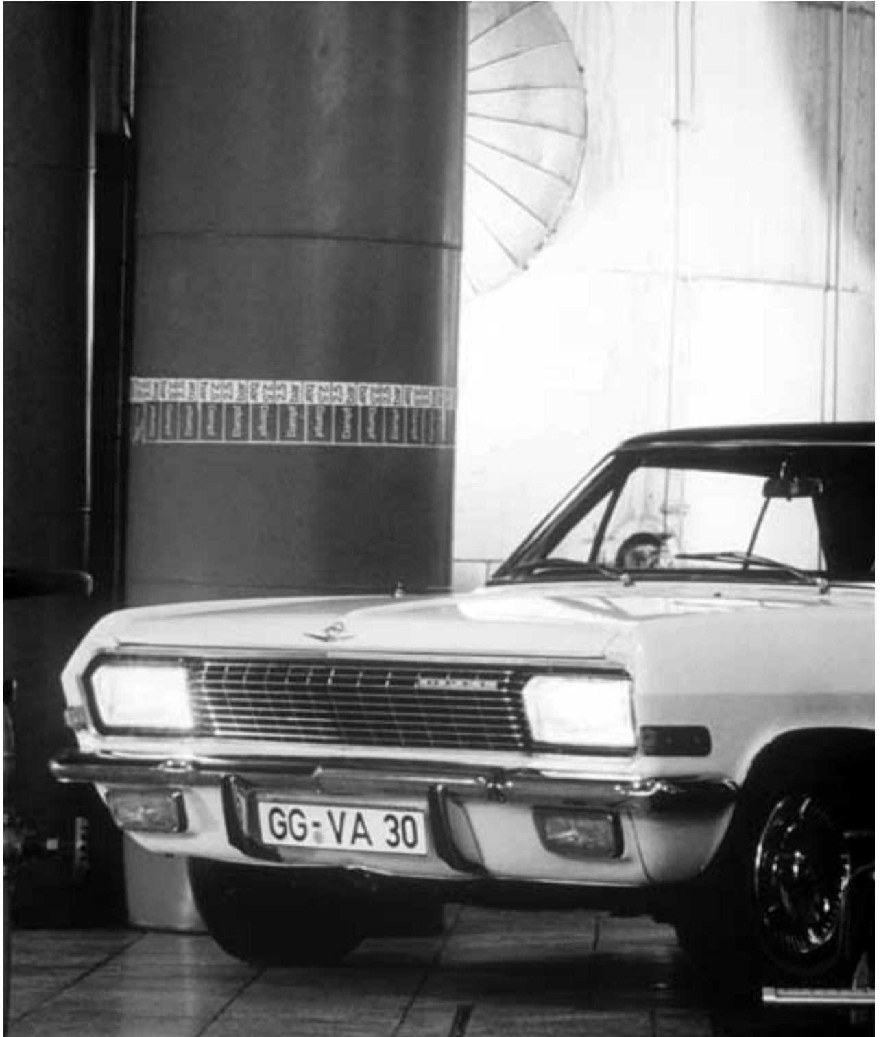
Wuchtig und schnörkellos: Die neue Sachlichkeit der KAD-A-Serie steht 1964 für die Nachfolge des Panorama-Kapitän.