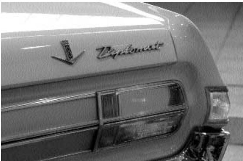
Das magische V8-Emblem repräsentiert 230 PS und ein ungeheures Drehmoment.

Mit dem Topmodell Diplomat hat Opel die Untertürkheimer Konkurrenz im