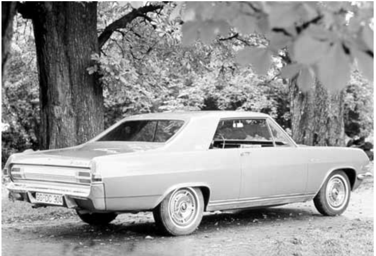
Eleganz ohne Übertreibung: Für 25.500 Mark bekam der Kunde ein Hardtop-Coupé als hinreißende Interpretation der neuen Sachlichkeit.